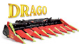
Lo spannocchiatore intelligente