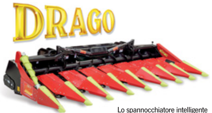
Lo spannocchiatore intelligente

mungitura dello stocco perfetta, raccolto totale senza perdite, maggiore produttività... e il tesoro è tutto vostro!